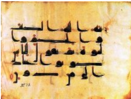
Feuillet d'un coran en écriture coufique IX-X e siècle, parchemin. Paris, BNF.

Les révélations faites par Dieu à Mahomet sont d'abord transmises oralement. Le texte complet est établi cinquante ans après la mort du prophète. Le Coran, qui rassemble ces révélations, est écrit en arabe et composé de 114 chapitres.