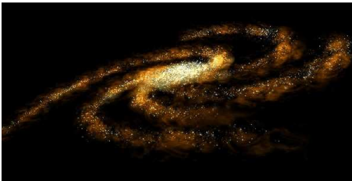
La Voie Lactée

Les étoiles sont des masses de gaz de forme sphérique, qui émettent de la lumière.